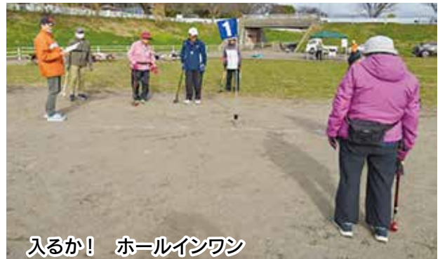
入るか! ホールインワン

新型コロナウイルス感染症もようやく減少方向になり、晴天の下、盛大に開催しました。