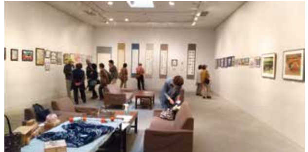
広い会場内に多くの力作が並びます