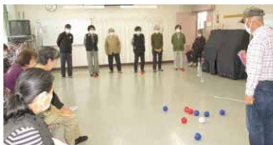
ルールを学び実際にプレー