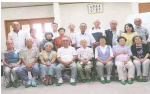
誕生会後に記念の1枚

朝日寿会は会員数46名（正会員32名）と小さなクラブです。また、平均年齢も83歳と高齢化しています。それにより、活発な活動は苦手な方が多いです。4年前に消滅の危機があり、私が会長になり会則を改訂しました。役職をさせられるのが嫌との声が多かったためです。