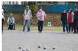
赤いボール目指してエイ!