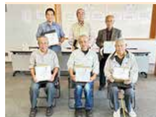
各クラスの優勝者

11月8日(水)、区役所にて第35回泉区高齢者囲碁将棋大会が開催され、囲碁・将棋それぞれABCの3クラスに分かれて対局が行われました。