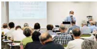
実務に使えるためになる研修