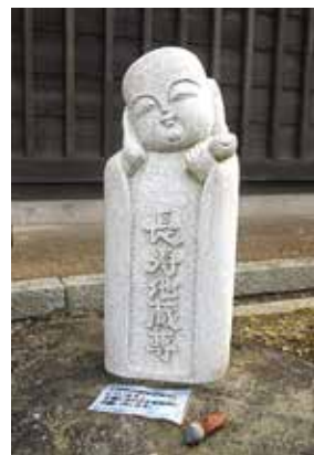
長寿地藏尊 (通称 ピンコロリ地蔵)

あけましておめでとうございます。私たちは泉区シニアクラブ連合会の活動を応援しています。