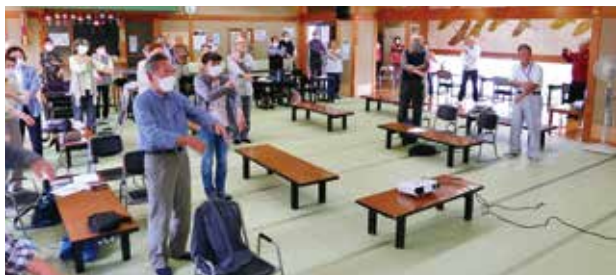
健康体操で体をほぐしてリラックス

中川地区シニアクラブ連合会は13クラブ（会員数803名）の構成で、それぞれ日々元気に活動しております。10月11日（水）、老人福祉センター（泉寿荘）にて中川地区友愛サロン交流会を開催しました。