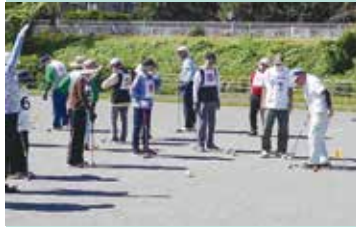
上位目指し熾烈な戦い

市老連からは、ねんりんピックに出場可能なチームの推薦を求められています。優勝、準優勝チームは市老連の大会（兼ねんりんピック横浜市代表決定予選会）に推薦されました。