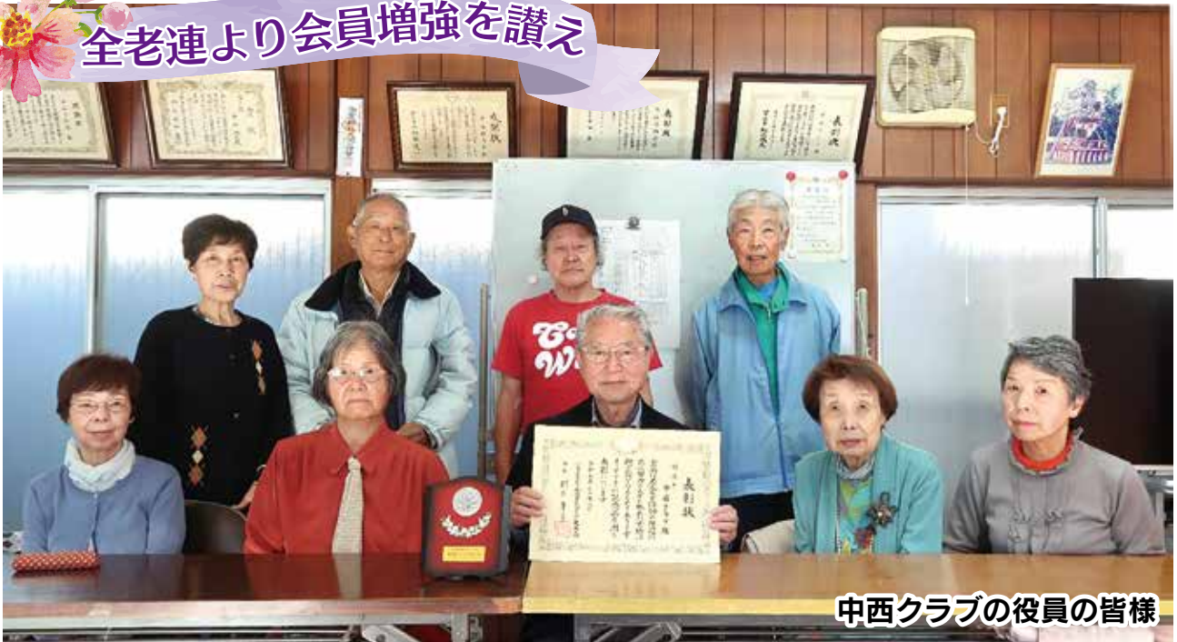
中西クラブの役員の皆様