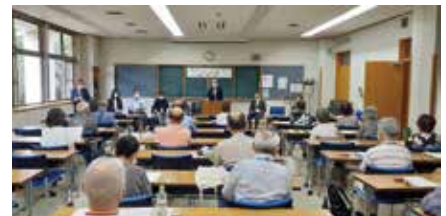
様々な知識を学びます

泉寿荘では、6月6日(火)の開講式から、共通講座では、「高齢者に必要な法律知識」「賢い消費者になるために」「健康寿命を延ばそう」「高齢者に多い事故とその予防」「薬との上手な付き合い方」「ネットのリスクを知る」「食生活による健康づくり」を学び、泉区の自主講座では「キャッシュレスの活用法」「落語の楽しみ方入門」「歌うチャームング体操」「シニアクラブ活動の